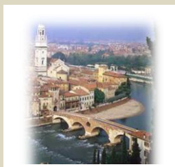
DTL VR Via Filopanti 3