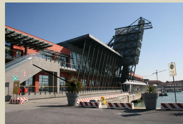
VENEZIA – STAZIONE MARITTIMA – - FABBRICATO 103 – PRIMO PIANO AUDITORIUM