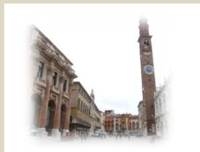
DTL VI Via Torino 11

IN TALE REALTÀ TERRITORIALE OPERANO LE DIREZIONI DEL LAVORO