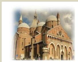
DTL PD Passaggio De Gasperi 3