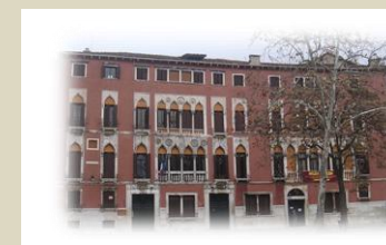
DRL VE Campo San Polo 2171

Per quelle sedi di cui non si è reperita una immagine si è optato per i luoghi più suggestivi della città