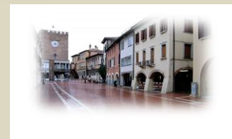
DTL VE Via Ca' Venier 8