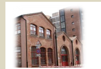
DTL TV Via Fonderia 55