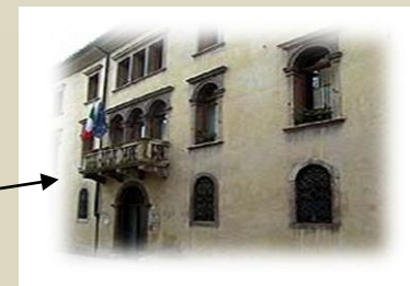
DTL BL Via Mezzaterra , 70