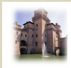
DTL RO Viale D. Piva 25/27